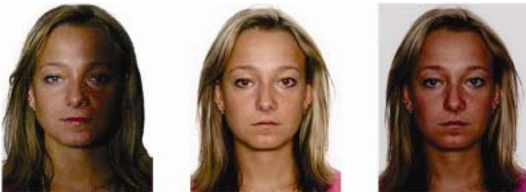
sombra sobre el rostro