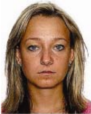
visible estructura de los píxeles