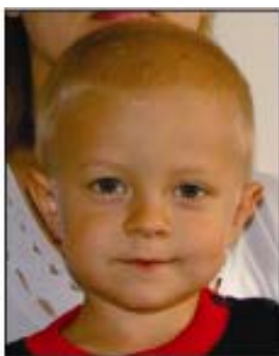
otra persona visible en el fondo