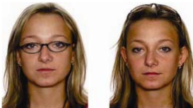
los marcos demasiado gruesos