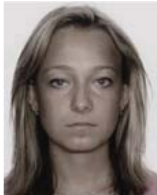
colores no naturales