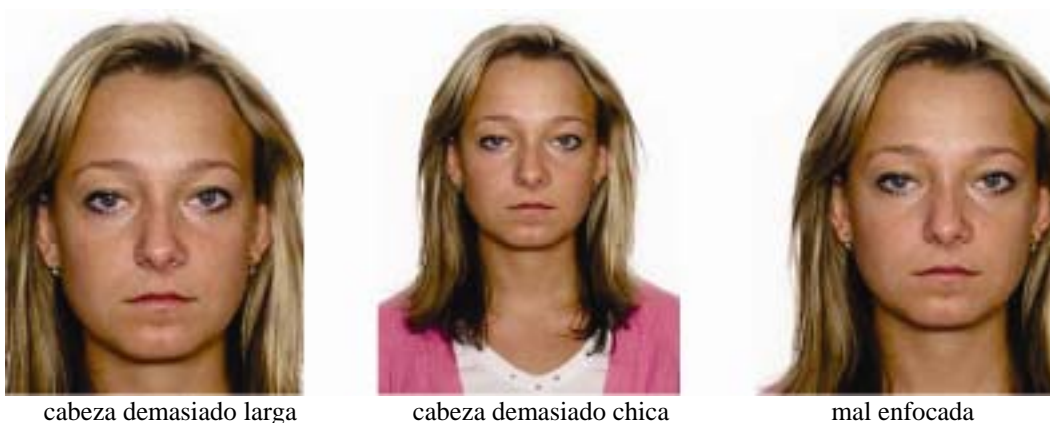
cabeza demasiado larga