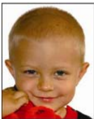
un juguete tapa parte del rostro

Se admiten excepciones a las indicaciones arriba mencionadas.