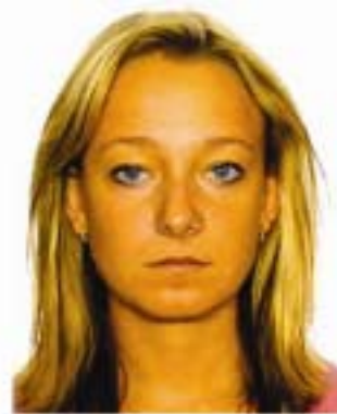
colores no naturales