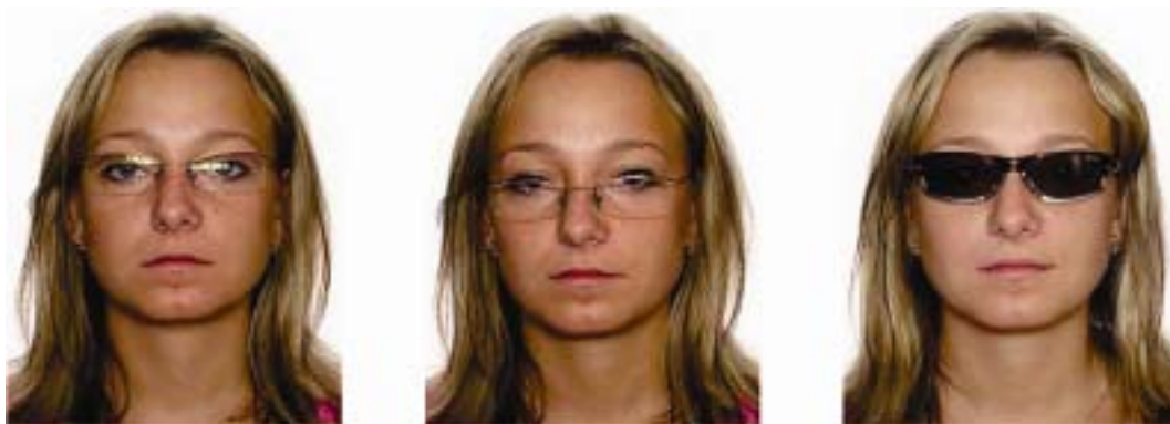
reflejos en los anteojos